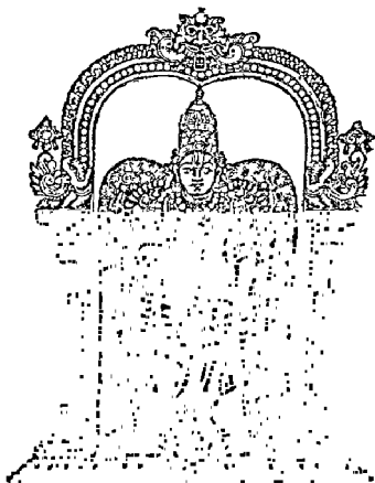
LORD SRI VENKATESWARA